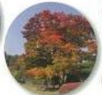
オオモミジ (管理事務所前)