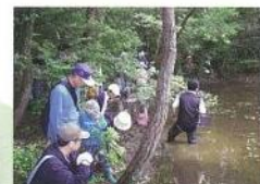
モリアオガエル観察会