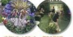
パピヨンドームのチョウ