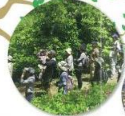
バードウォッチング