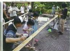
イベント(そうめん流し)