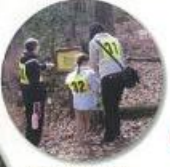
グリーンアドベンチャー