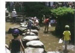
アユのつかみ取り