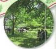
レストハウスの裏庭