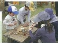
ネイチャークラフト