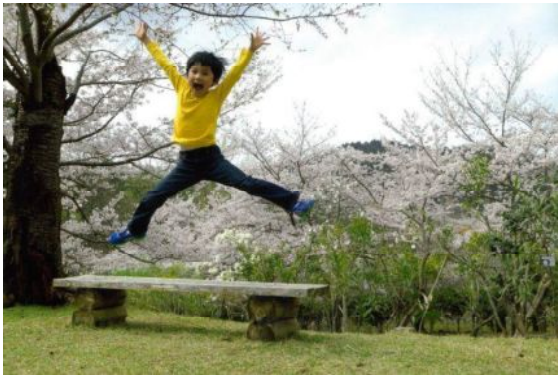
『バンザイ きれいだ!』