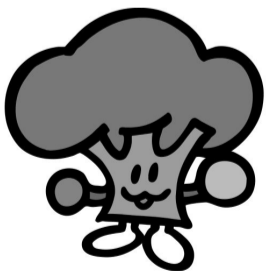
ひろしまの森づくりキャラクター「モーリー」