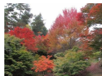
I ハナノキとイロハモミジ