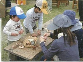
ネイチャークラフト