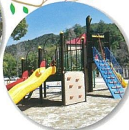
多目的広場の遊具