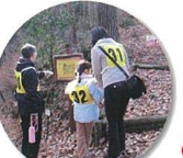
グリーンアドベンチャー