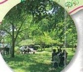
レストハウスの裏庭