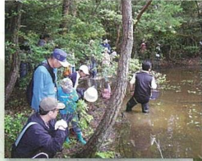
モリアオガエル観察会