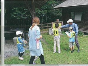
グリーンアドベンチャー