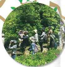
バードウォッチング