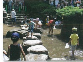
アユのつかみ取り