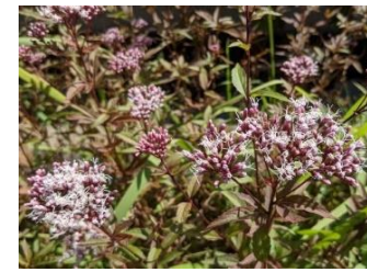
コバノフジバカマ