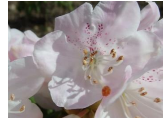
西洋シャクナゲ”赤星”