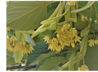
チュウゴクボダイジュ