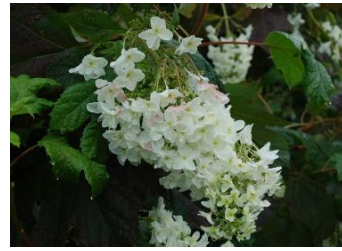
カシワバアジサイ