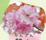
かんざん 閑山 4月上旬