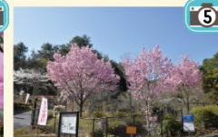
レストハウス入口で 陽光がお出迎えます。