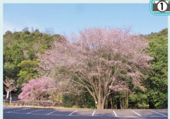
山桜と八重紅枝垂を眺めて...

高さ16m、枝張14mもある大きな山桜があります。満開の山桜は圧巻！隠れた花見スポットです。