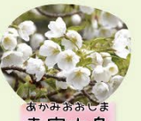
あかみおおしま 赤美大島 3月下旬