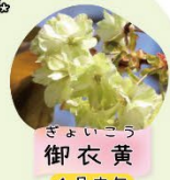
ぎょいごう 御衣黄 4月中旬