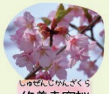
しぜんじかんざくら 修善寺寒桜 3月中旬