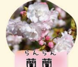
らんらん 蘭蘭 4月上旬