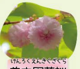
けんろくえんざくら 兼六園菊桜 4月中旬