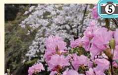
さくらと早咲きつづじの コラボレーション