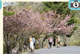
花が大きい閑山は見ごたえがあります！