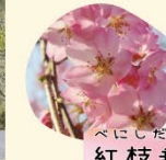
べにじだれ 紅枝垂 3月下旬