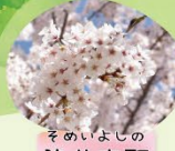
そめいよしの 染井吉野 3月下旬