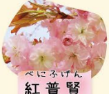
べにふげん 紅普賢 4月中旬