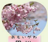
おもいがわ 思川 3月下旬