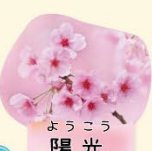
ようこう 陽光 3月下旬