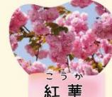
こうか 紅華 4月上旬