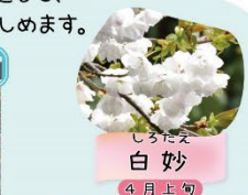
しろたえ 白妙 4月上旬