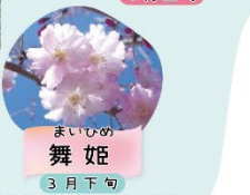
まいひめ 舞姫 3月下旬