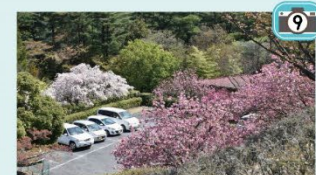
奥が八重紅枝垂 手前が閑山です

管理事務所～わんこひろばを歩いて巡ると、閑山や舞姫、江戸、楊貴妃などがたのしめます。