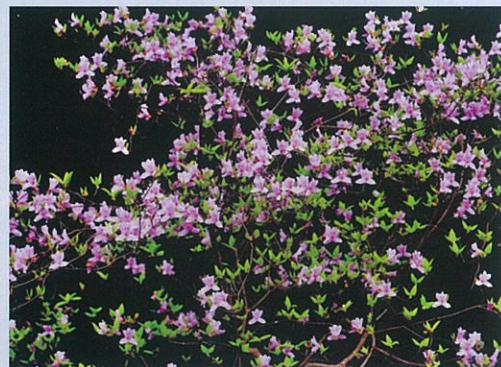
第3回 ひろしま遊学の森 四季の移ろい 写真コンテスト 特選「ごはんですよ〜」