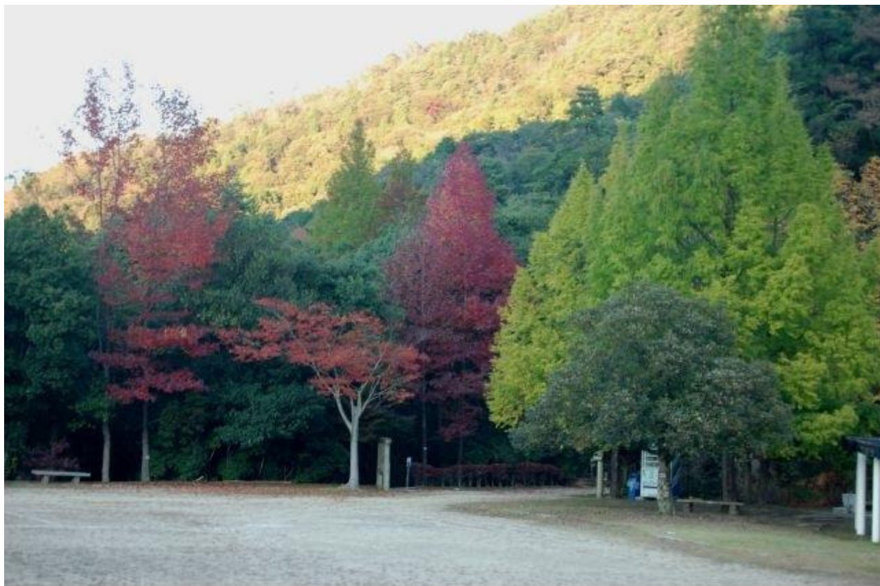
写真1 多目的広場入り口紅葉状況（左からモミジバフウ、ケヤキ、モミジバフウ、メタコセイア） H26.10.28