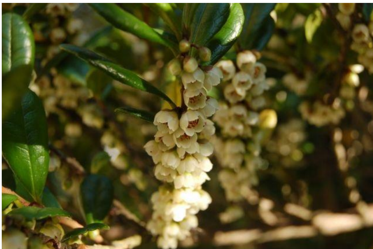
写真3 ハマヒサカキ（管理事務所前） H26.10.28