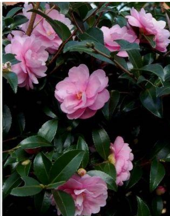
写真1右 乙女サザンカ（見本園入口） H27.10.26