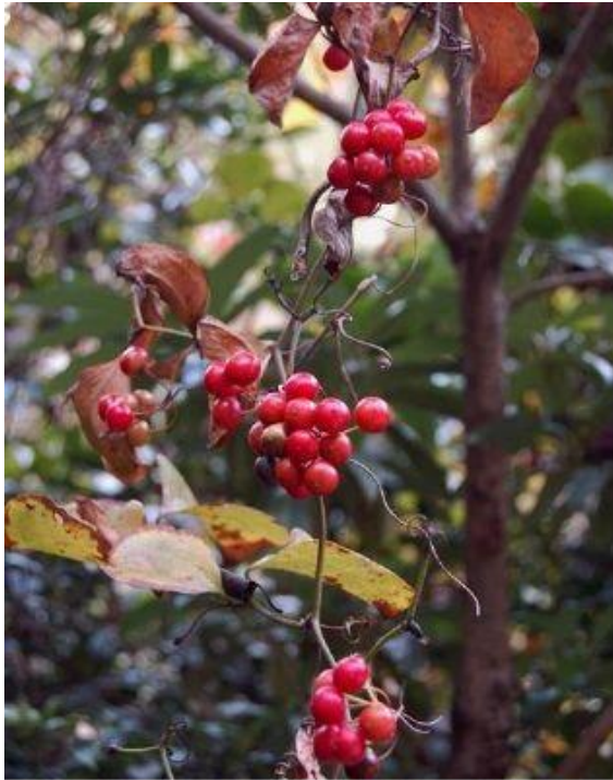
写真3左 サルトリイバラ (東山作業路) H27.10.27