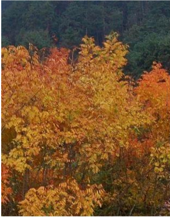
写真2左 ランシンボク (苗畑) H27.10.27