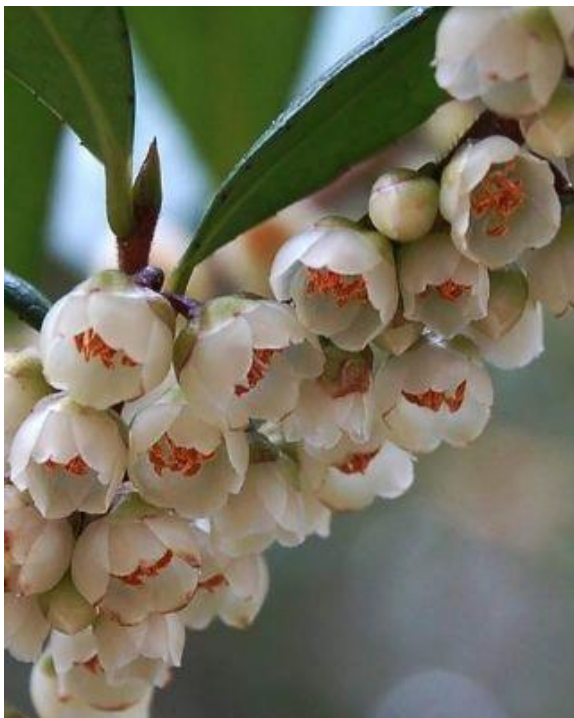
写真1左 ハマヒサカキ（管理事務所前） H27.10.27

内容：標高665mの藤ヶ丸山の山頂を目指して紅葉狩りハイキングを実施します。通常コースと健脚コースがあり、申し込みはハガキで行います。詳細は広島市森林公園（電話899-8241）へお問い合わせください。