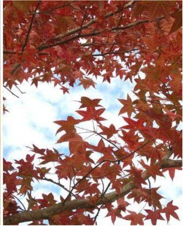
写真2右 モミジバフウ (多目的広場) H27.10.26