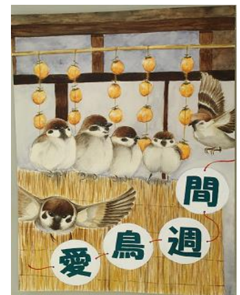
愛鳥週間原画コンクール 入賞作品より