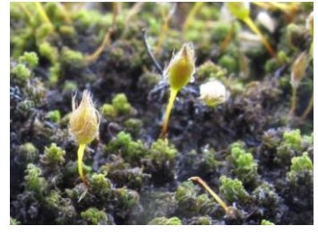
ミノゴケ(乾燥時の葉と蒴)

コダマゴケは樹幹や石灰岩によく見られるコケで、濃い緑色の小さなかたまりが着生しています。乾燥に耐えるコケで、乾燥しているときは、葉が茎にそってつき、その間から溝のあるつり鐘のような帽子をつけた卵型の蒴が顔をだしています。蒴柄は短いため、葉に隠れて見えません。(山根)