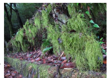
キヨスミイトゴケ

新緑の時期、緑化センターの入り口はモミジのトンネルで薄暗いほどです。モミジの間にはツツジが植えられていますが、その枝にカーテンのようにぶら下がっているのはキヨスミイトゴケです。樹木の枝に絡まったように長く垂れ下がり、谷川沿いの湿度の高い場所に生育します。名前は千葉県清澄山に由来します。