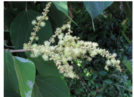
アカメガシワの雄花

樹皮がはがれやすく、初夏に太い枝の皮を採取し、陰干しにしたものを胃腸薬や下痢止めに利用されます。また、赤い若葉や種子から赤色の染料が取れます。材は緻密で床柱、下駄、琴の材料として、とても有用な植物となっています。また成長が早く生命力がある樹木で、伐採跡地、崩壊地、林縁などの明るいところに生え、緑化センターの園内でもよく見られます。(上村)