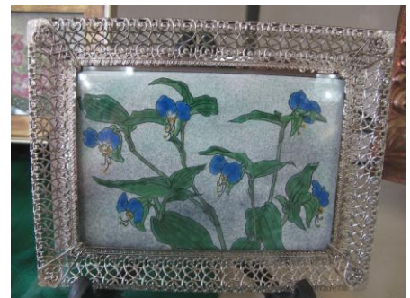
七宝焼作品展より