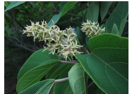
アカメガシワの雌花