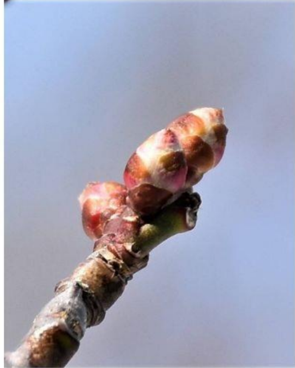
写真2右 ウメの花芽 (見本園) H30.1.27