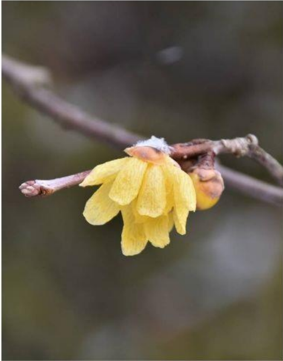
写真2左 ソシンロウバイ (管理事務所前) H30.1.27