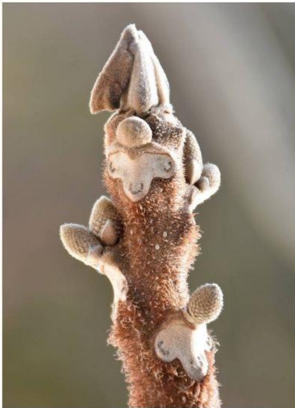
写真3左 オニグルミの葉痕と冬芽 (わんこ広場駐車場) H30.1.27