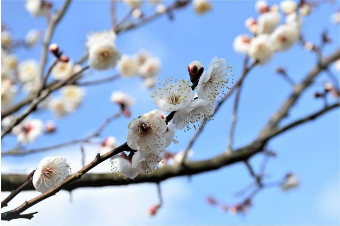
写真1 ウメ (苗畑) H31.1.17