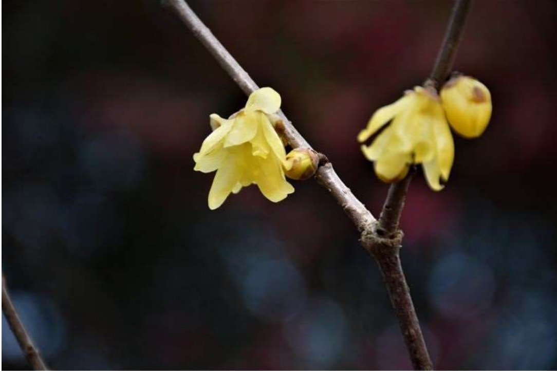
写真3 ソシンロウバイ（管理事務所前） H31.1.17