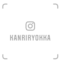
Instagram 公式アカウント ネームタグ