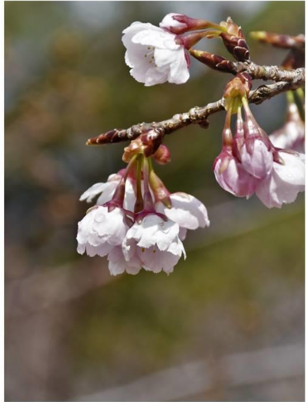
写真1右 大寒桜（第5駐車場） R2.3.14