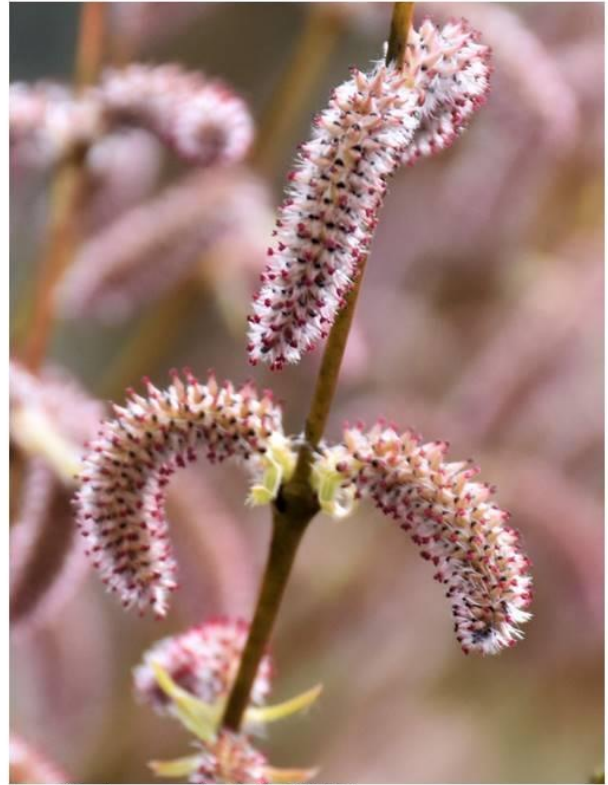
写真3右 コリヤナギ (苗畑) R2.3.14