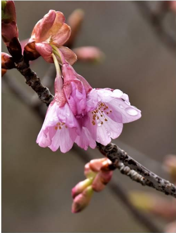
写真1左 修善寺寒桜（さくら通り） R2.3.14