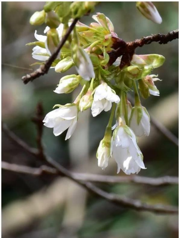
写真2左 寒咲大島（作業舎裏） R2.3.14