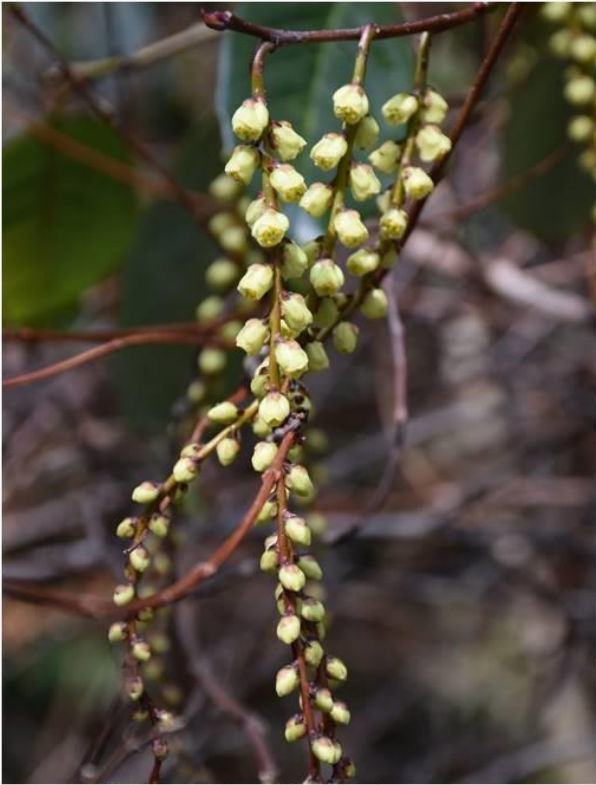
写真3左 キブシ (中水池下) R2.3.14