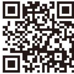
公式ウェブサイト