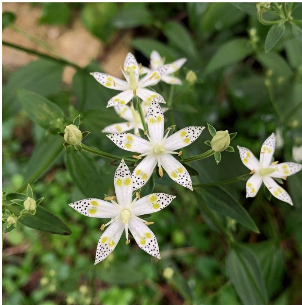
【写真3】 アケボノソウ（湿地植物園） R2.9.24