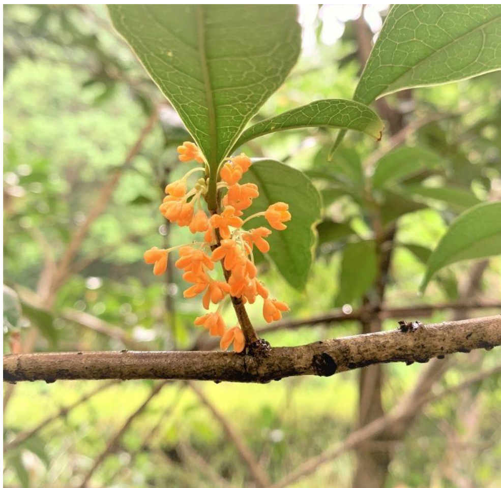
【写真1】 キンモクセイ（学習展示館前） R2.9.24

10月25日（日）に予定しておりました、 「つづらふじでカゴ作り」 ですが、講師の都合により、 中止となりました。 よろしくお願いいたします。